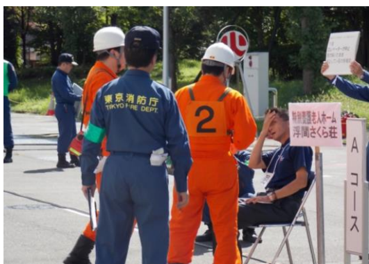
「どのように怪我をしましたか？」 「応急手当いたします。」

平成27年9月11日（金）、東京都下水道局西部第二下水道事務所浮間水再生センターにて赤羽消防署・赤羽防火管理研究会共催の平成27年度自衛消防訓練審査会が開催されました。浮間さくら荘は、3名の職員が1号消火栓の部（男子・男女混成隊）に参加し最後まで安全性、確実性、迅速性、チームワークに心がけ優良賞をいただくことができました。訓練を通して、チームワークの大切さを痛感し今後の業務に役立てていきたいと思ひます。