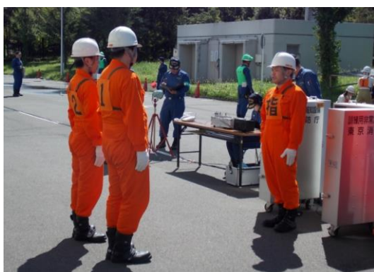
「被害状況の報告」 「現場の確認、火災発生への報告」 「119番通報」