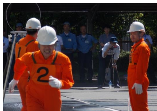
「消火栓による消火活動開始！」